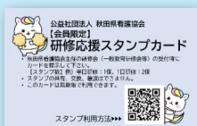
【新：研修応援スタンプカード】

●秋田県看護協会会員様限定のサービス。1日研修で2つ、半日研修で1つスタンプを貯めて、貯めたスタンプで対象の研修が無料で受講できます。